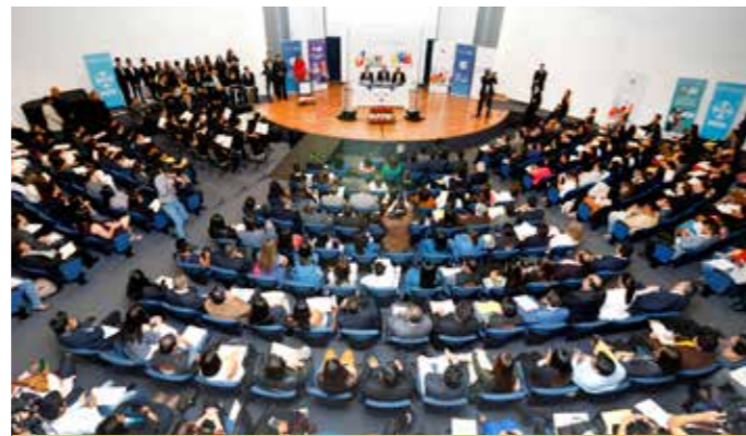
El evento se realizó en el auditorio de la Pontificia Universidad Católica del Ecuador en Quito y contó con la presencia de cientos de jóvenes.

Además, el primer mandatario suscribió el Decreto Ejecutivo No. 489 que designa recursos económicos para fomentar empleabilidad de jóvenes entre 18 y 29 años a escala nacional. ■