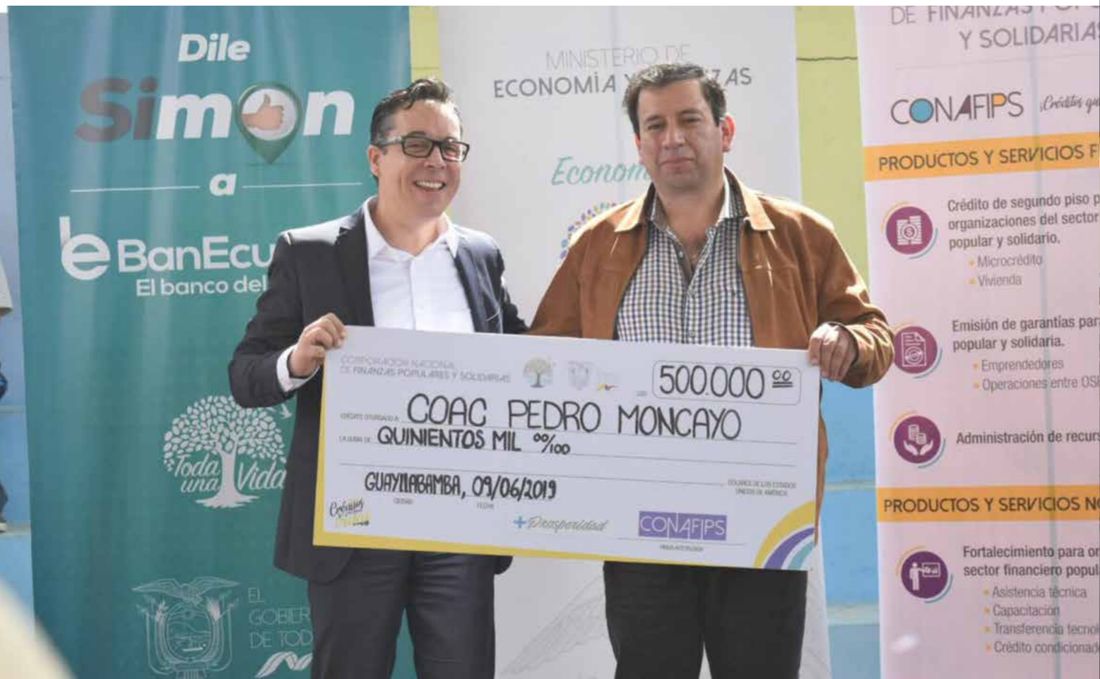
La Cooperativa de Ahorro y Crédito Pedro Moncayo recibió recursos por parte de la CONAFIPS para financiar emprendimientos. La Corporación también participó en la feria ciudadana.