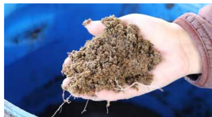
La melaza es un abono utilizado para desintoxicar el suelo.