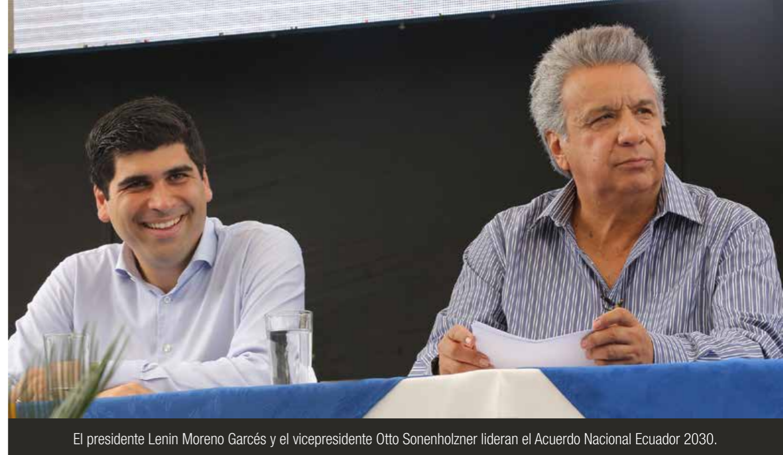
El presidente Lenin Moreno Garcés y el vicepresidente Otto Sonnenholzner lideran el Acuerdo Nacional Ecuador 2030.