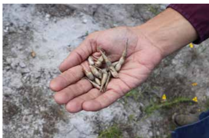
Semillas de rábanos cosechados en cultivos agroecológicos.

Cuenta que su aspiración es montar un laboratorio químico para continuar cultivando materiales orgánicos y distribuirlos en todo el país. Sin embargo, ahora su prioridad es continuar abasteciendo el negocio y ampliar el terreno.