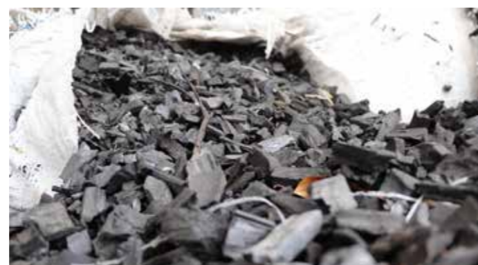
Abono agroecológico de carbón de caña.