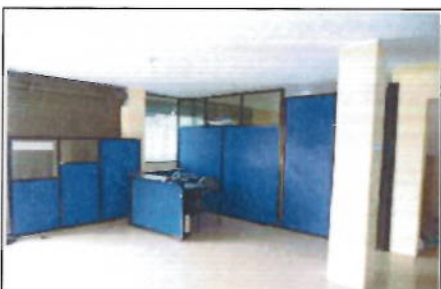
PLANTA BAJA - ÁREA DE OFICINAS - VISTA 2