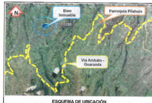
ESQUEMA DE UBICACIÓN