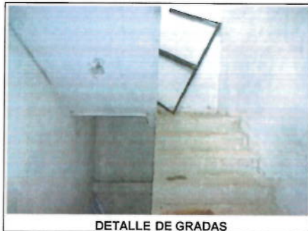
DETALLE DE GRADAS