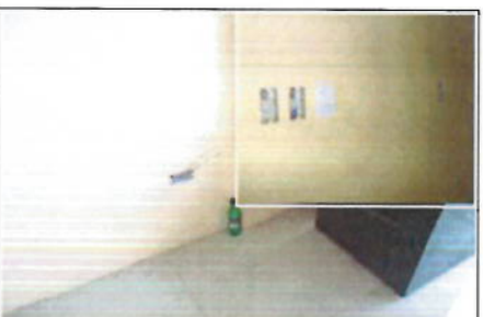
PRIMERA PLANTA ALTA - DETALLES