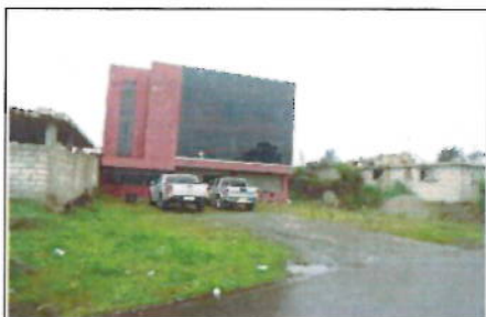
VISTA GENERAL DEL INMUEBLE