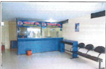
PLANTA BAJA - ÁREA DE OFICINAS - VISTA 1