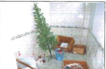
PRIMERA PLANTA ALTA - ÁREA DE BAÑO