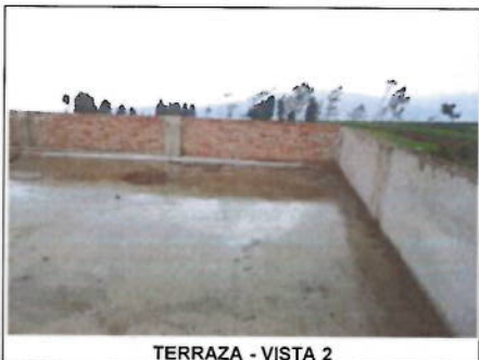
TERRAZA - VISTA 2