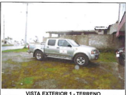
VISTA EXTERIOR 1 - TERRENO