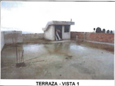
TERRAZA - VISTA 1