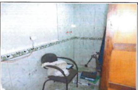
PLANTA ALTA - ÁREA DE BAÑO