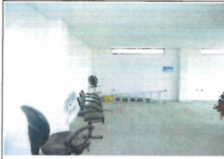
SEGUNDA PLANTA ALTA - VISTA GENERAL 1