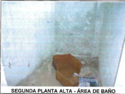
SEGUNDA PLANTA ALTA - ÁREA DE BAÑO