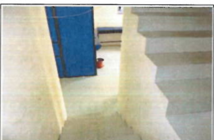
ÁREA DE GRADAS