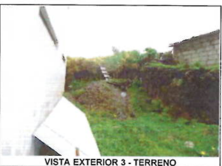
VISTA EXTERIOR 3 - TERRENO