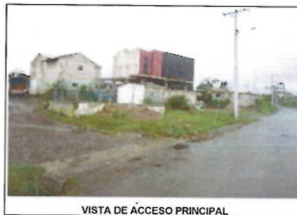
VISTA DE ACCESO PRINCIPAL