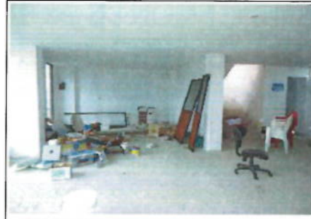
SEGUNDA PLANTA ALTA - VISTA GENERAL 2