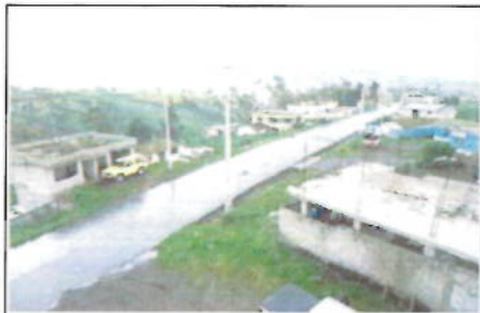
VISTA DE ACCESO AL INMUEBLE