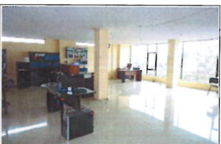
PRIMERA PLANTA ALTA - ÁREA DE OFICINAS VISTA 2