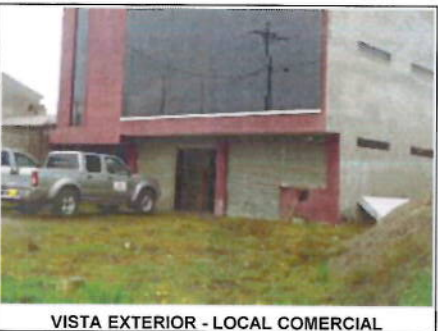
VISTA EXTERIOR - LOCAL COMERCIAL