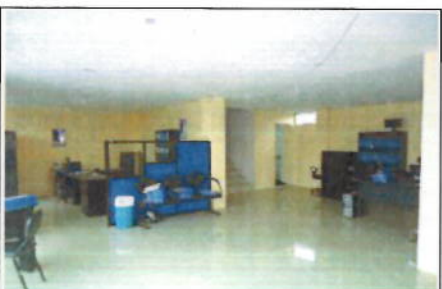
PRIMERA PLANTA ALTA - ÁREA DE OFICINAS VISTA 1