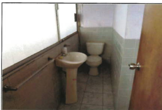
OFICINA 12-01 (D) - MEDIO BAÑO