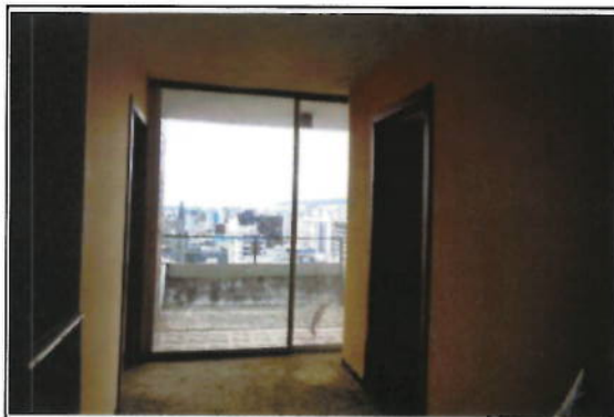
OFICINA 12-01 (D) - OFICINA