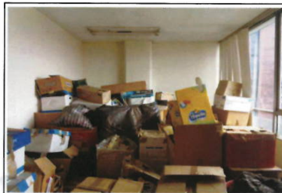
OFICINA 12-01 (D) - OFICINA