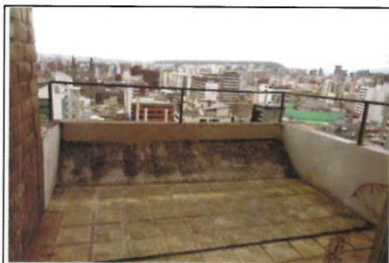
OFICINA 12-01 (D) - BALCÓN CUBIERTO