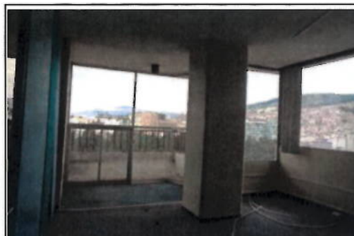
OFICINA 12-03(A) - ÁREA DE OFICINAS