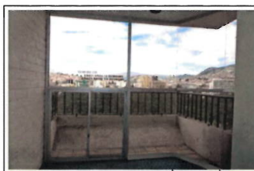
OFICINA 12-03(A) - AMPLIACIÓN (BALCÓN CUBIERTO)