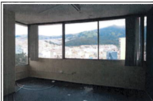
OFICINA 12-03(A) - ÁREAS DE OFICINAS