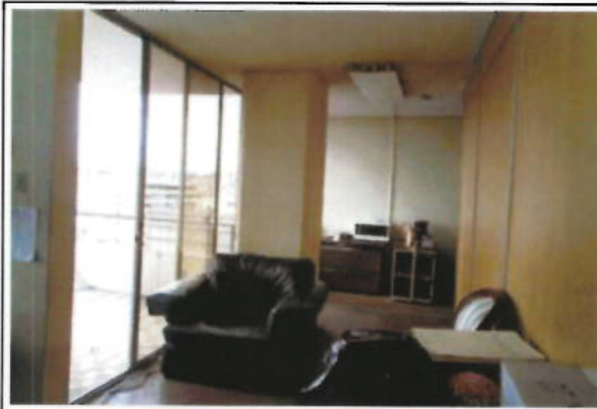
OFICINA 10-01(D) - ÁREAS DE OFICINAS