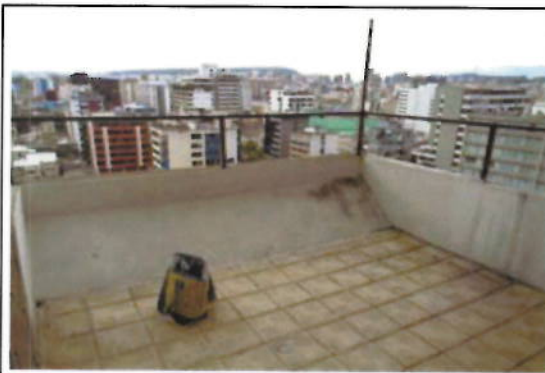
OFICINA 10-01(D) - BALCÓN CUBIERTO