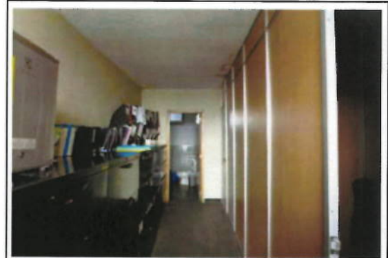
OFICINA 10-01(D) - ÁREA DE OFICINAS