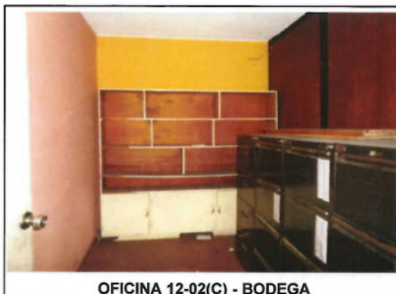
OFICINA 12-02(C) - BODEGA