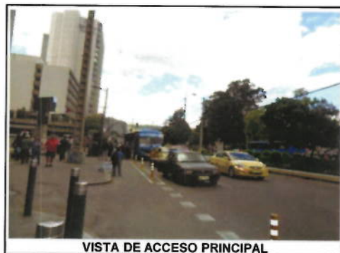
VISTA DE ACCESO PRINCIPAL