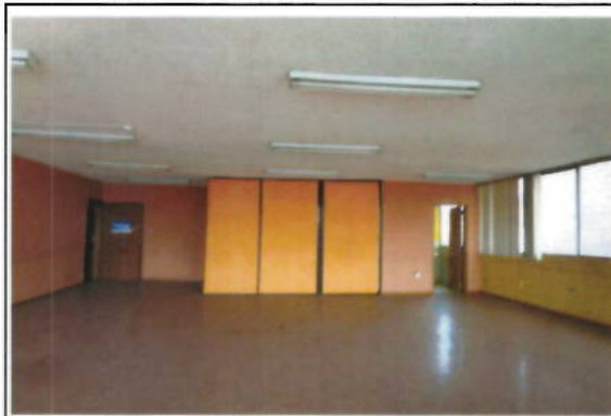
OFICINA 12-02(C) - ÁREAS DE OFICINAS