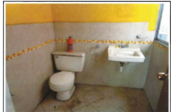
OFICINA 12-02(C) - MEDIO BAÑO