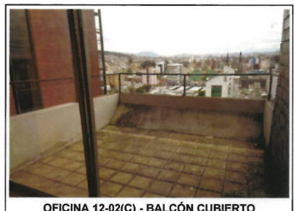
OFICINA 12-02(C) - BALCÓN CUBIERTO