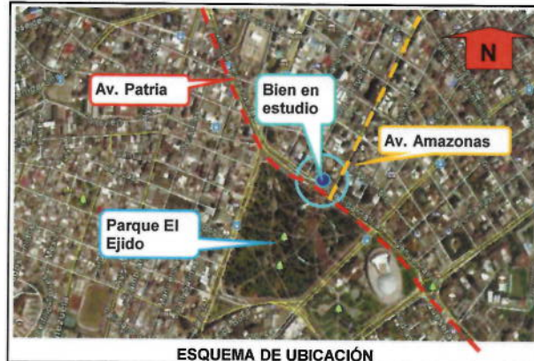
ESQUEMA DE UBICACIÓN