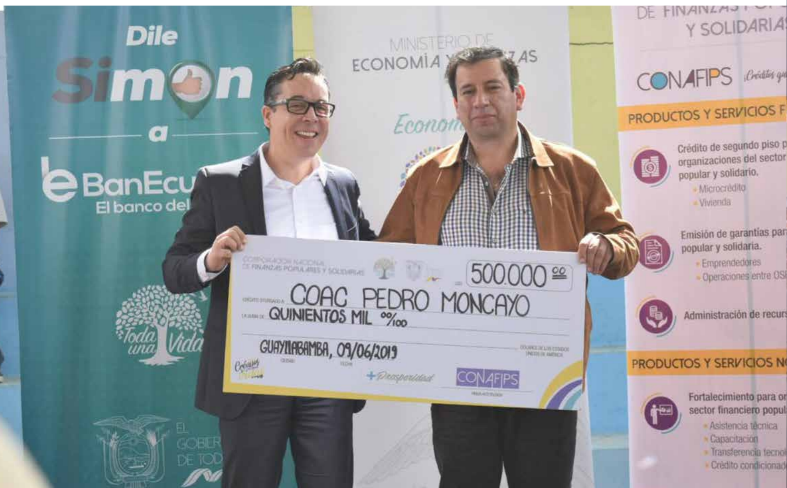
La Cooperativa de Ahorro y Crédito Pedro Moncayo recibió recursos por parte de la CONAFIPS para financiar emprendimientos. La Corporación también participó en la feria ciudadana.