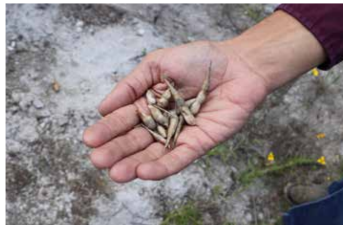
Semillas de rábanos cosechados en cultivos agroecológicos.

Cuenta que su aspiración es montar un laboratorio químico para continuar cultivando materiales orgánicos y distribuirlos en todo el país. Sin embargo, ahora su prioridad es continuar abasteciendo el negocio y ampliar el terreno.