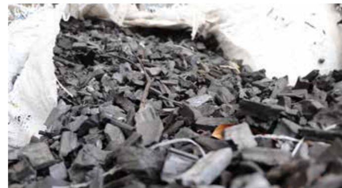
Abono agroecológico de carbón de caña.