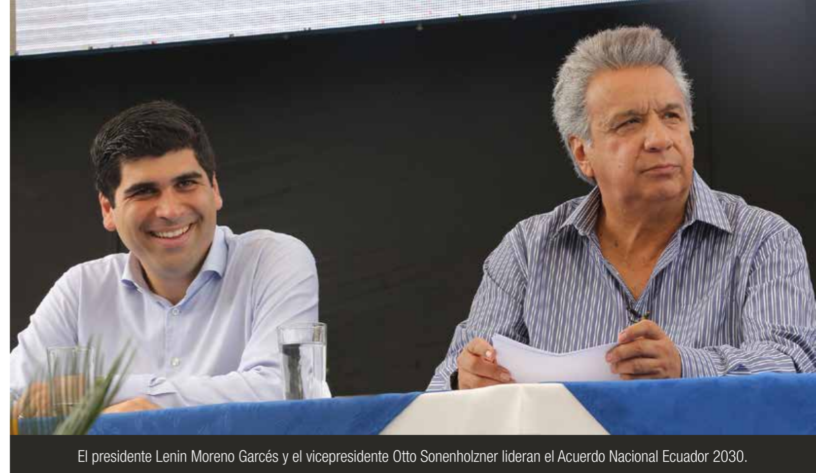
El presidente Lenin Moreno Garcés y el vicepresidente Otto Sonnenholzner lideran el Acuerdo Nacional Ecuador 2030.