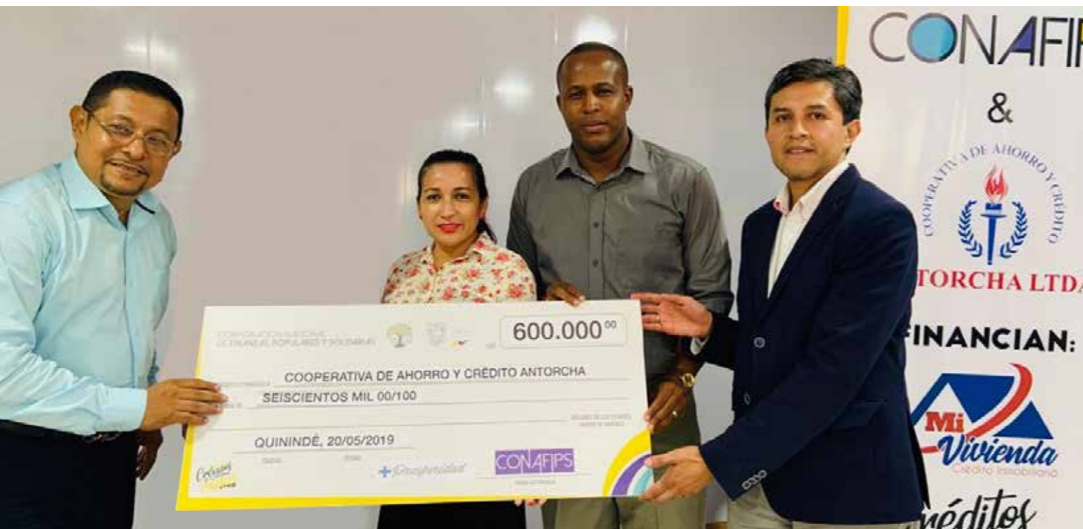
La Cooperativa de Ahorro y Crédito Pedro Moncayo recibió recursos por parte de la CONAFIPS para financiar emprendimientos. La Corporación también participó en la feria ciudadana.